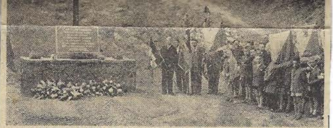
Voici une vue du mémorial qui vient d'être inauguré.

Le 28 octobre 1942, on perquisitionne à son domicile, le major Servais est absent. On emmène son fils. Rentré de voyage, il se pre-