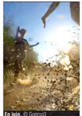
En juin.