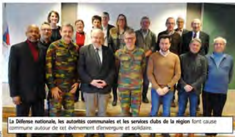
La Défense nationale, les autorités communales et les services clubs de la région font cause commune autour de cet événement d'envergure et solidaire.

Cette journée ouverte à tous, sera donc à la fois sportive, militaire et solidaire et se déroulera inégalement sur le site du camp militaire. Les clubs de sport de la région présenteront leurs activités au grand public dans le cadre du Salon Sport en Marche qui ne se déroulera dans plus fin mai comme ces dernières années. Les unités du « plateau camp roi Albert » feront, quant à elles, découvrir les métiers du soldat ; alors que le camp, les services clubs et les associations parrainées organiseront la partie solidaire, baptisée « Ent'RAID et Sports au camp ». Il s'agit d'un événement multiforme à caractère caritatif.