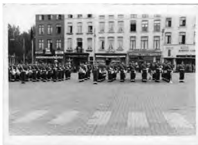
Bernard Chevalier Conservateur

C'était toujours l'époque où les sonneries (Réveil, extinction des feux et lumières, appel du personnel de semaine des différentes compagnies, le rassemblement, le repas, l'appel des punis, ...) s'effectuaient au clairon !!