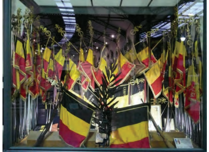
Vitrine de gauche où sont entreposés les emblèmes des unités dissoutes ayant un chiffre pair 2 ème Chasseurs à Pied

Ci-dessous l'attestation de remise du drapeau du 2 ème Chasseurs à Pied au Musée Royal de l'Armée.