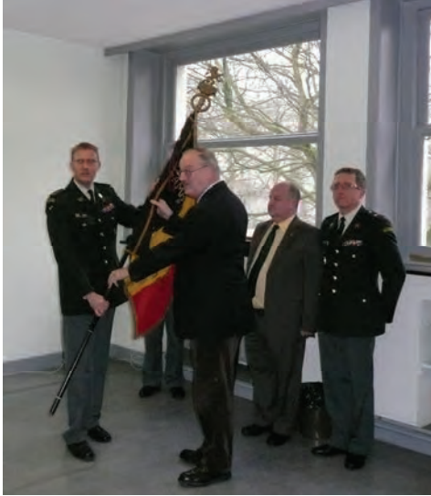
Le Chef de Corps remet le drapeau du 2 ème Chasseurs à Pied au Directeur du Musée Royal de l'Armée

C'est le 21 Février 2011 que le drapeau du 2 ème Chasseurs à Pied a quitté son unité pour rejoindre le Musée Royal de l'Armée où il se trouve en dépôt, rejoignant ainsi un grand nombre de nos unités dissoutes.