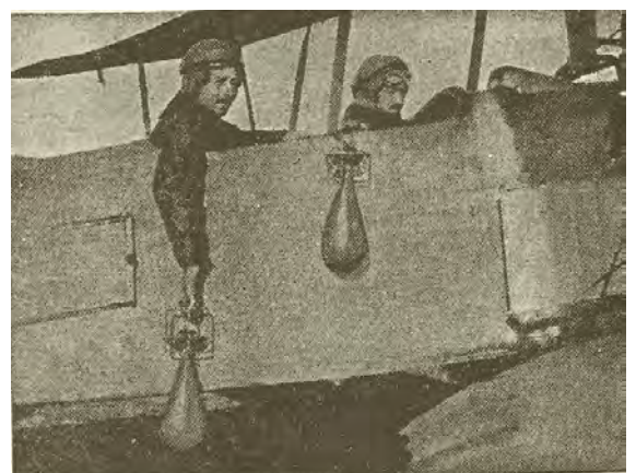
Un aviateur et ses bombes

Que se passait-il dans le détonateur au moment de l'impact de la bombe sur son objectif ; le percuteur mobile continuant son mouvement de chute, comprimait le ressort qui le tenait éloigné de l'amorce. Le percuteur venait alors percuter l'amorce provoquant ainsi son explosion et donc celle de la charge explosive contenue dans la bombe.