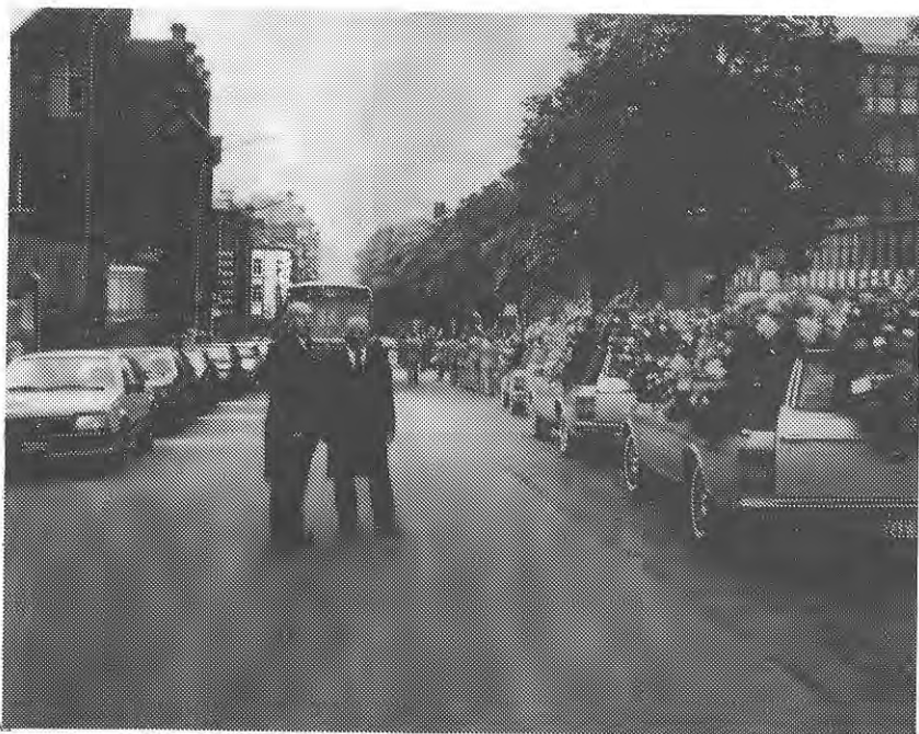
Une vue du cortège funèbre.