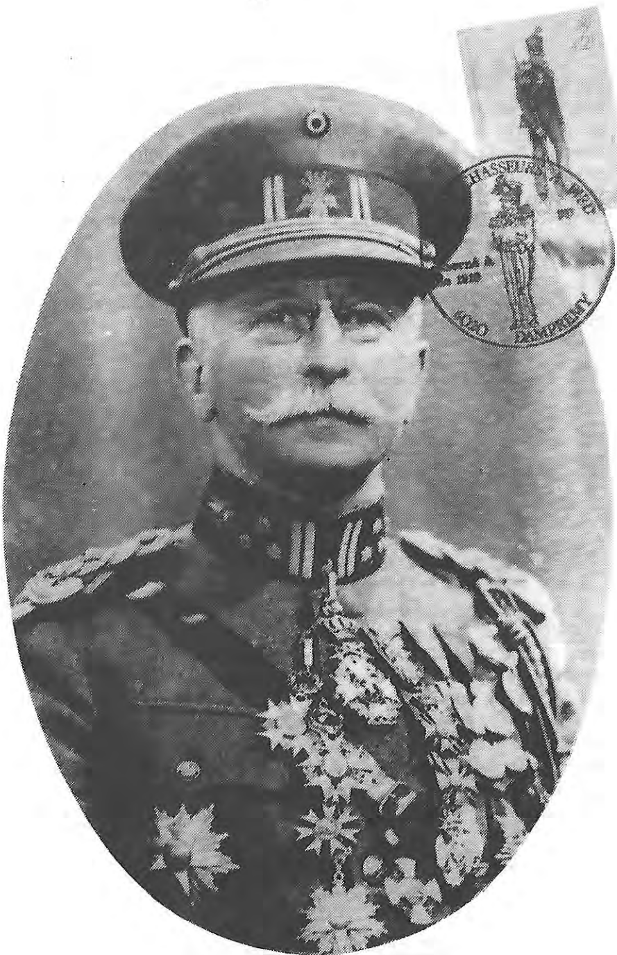
Photo du Général PANHUYS. (Colonel, commandant le 2ème Régiment des Chasseurs à Pied de 1917 à 1920)