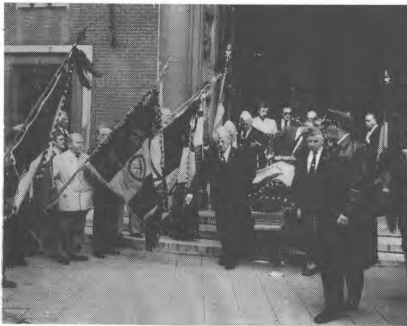
La levée du corps à la Basilique St. Christophe de CHARLEROI.