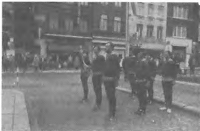
LE FLAMBEAU VENU DE SIEGEN et SES PORTEURS.

Cette manifestation était placée sous le signe de l'Année Internationale de l'Enfant et que son bénéfice a été intégralement versé à l'ASBL "Aide et santé", qui s'occupe d'enfants hospitalisés.