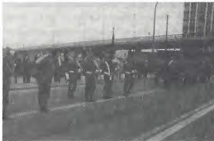
LE SALUT AU DRAPEAU.

Une très courte prise d'armes eut lieu dans la cour de la caserne au cours de laquelle la plaquette-souvenir du centenaire du drapeau fut offerte par le Chef de Corps aux deux invités d'honneur.