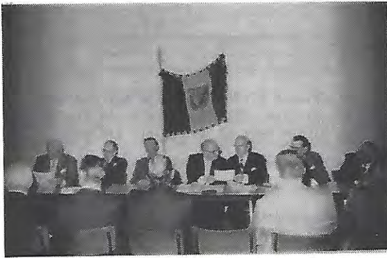
PHOTO 1. Le Bureau de l'Amicale lors de l'Assemblée Générale du 28 Janvier 1978