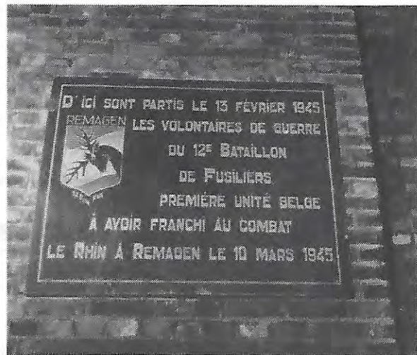
PHOTO 6. La plaque commémorative apposée sur la façade intérieure du porche d'entrée de la caserne Trésaignies et inaugurée le 6 mai 1978 lors de la journée du 12 e Bataillon de Fusiliers "Remagen".